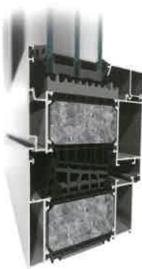
MB-104 Passive SI