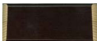
ODSTÍN - Č.10 PALISANDR P200T2 palisandr / P420HV palisandr