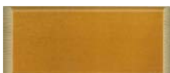
ODSTÍN - Č.5 ZLATÝ TEAK P200T2 zlatý teak / P420HV zl.teak