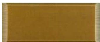
ODSTÍN - Č.3 SVĚTLÝ DUB P200T2 světlý dub / P420HV sv. dub