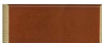
ODSTÍN - Č.7 MAHAGON P200T2 mahagon / P420HV mahagon